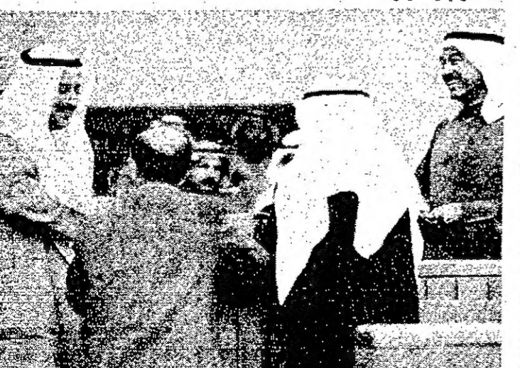
عدد من الحضور أمس